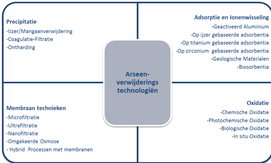
Afbeelding 1: Overzicht van arseenverwijderingstechnologiën