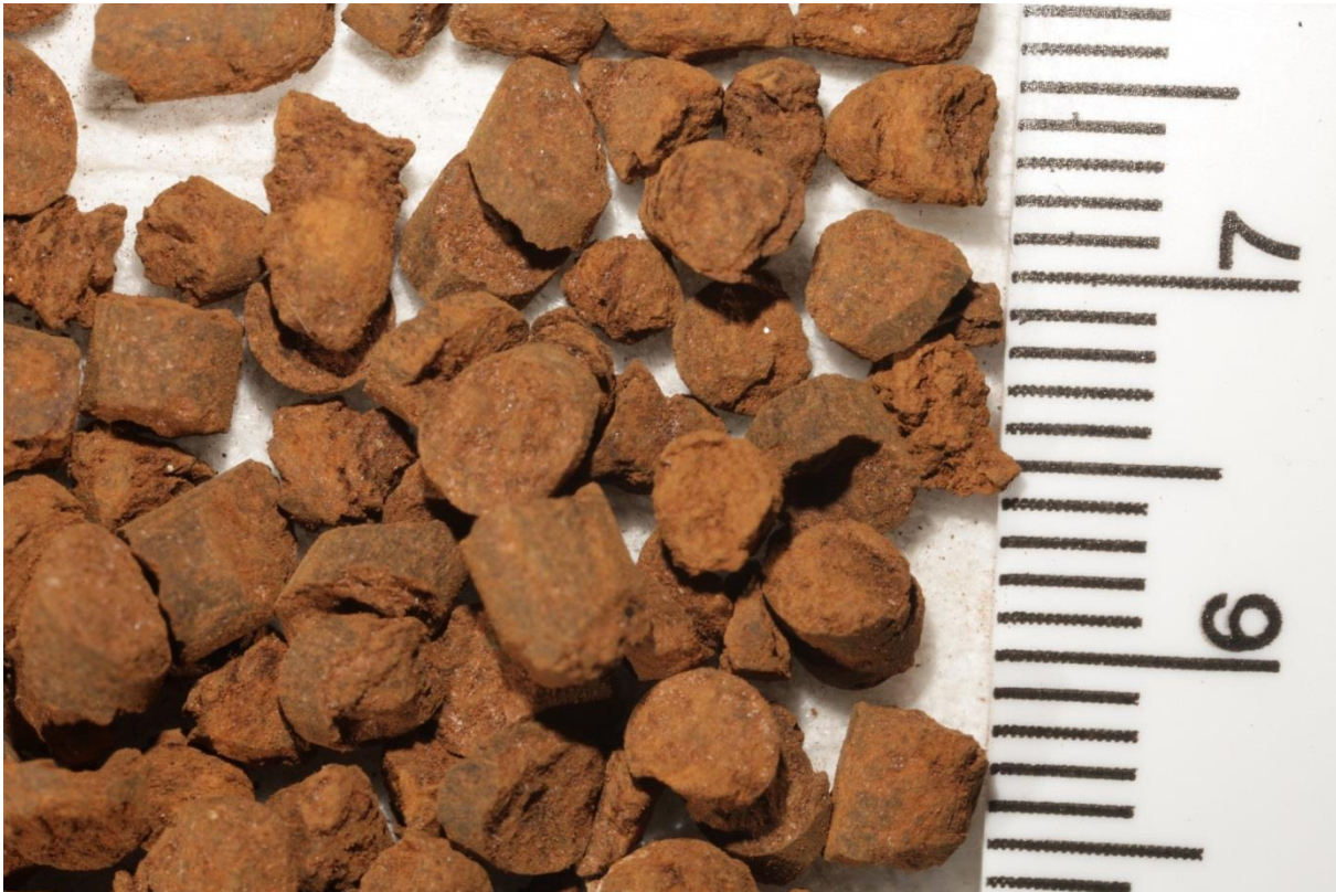
Afbeelding 3. Op ijzeroxide gebaseerde pellets voor de adsorptie van fosfaat en arseen, die worden ontwikkeld bij KWR Watercycle Research Institute