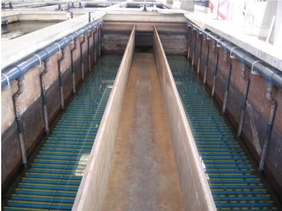
2.6 Werkzaamheden aan een snelfilter voor de behandeling van oppervlaktewater (effectzone oranje) met een relatief kleine kans op verontreiniging vallen in risicoklasse II.