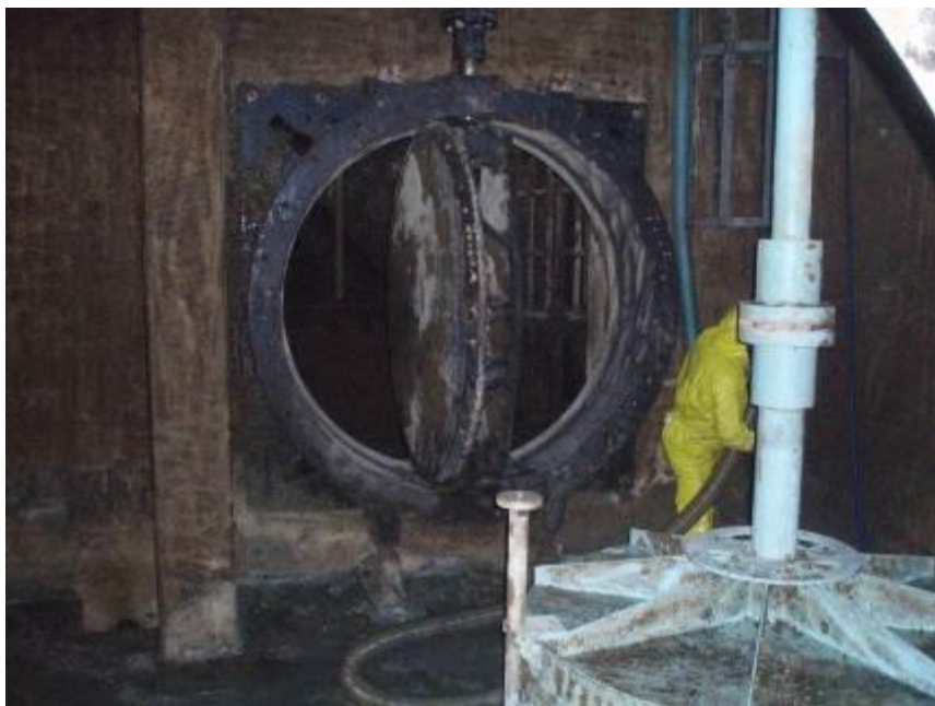
2.5 Werkzaamheden aan het uitlaatpompstation van spaarbekken 'Petrusplaat' (effectzone blauw) vallen binnen risicoklasse I.