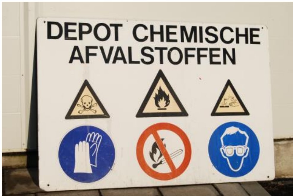
2.3.9 Verantwoorde afvoer van restanten desinfectiemiddel.