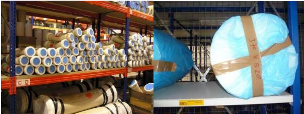
2.2.3 Bescherming van leidingmaterialen tijdens opslag in een magazijn.