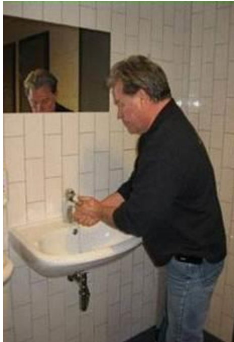
2.1.2 Handen wassen is een belangrijk onderdeel van hygiënisch werken.