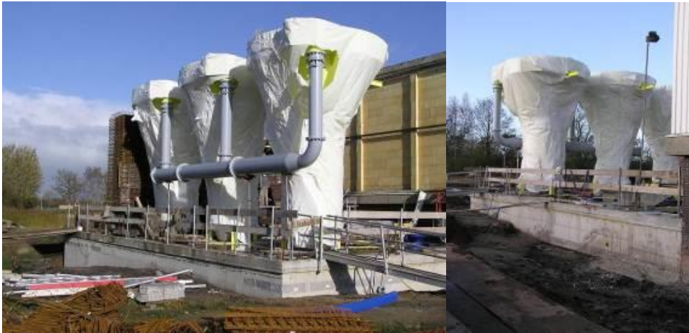
2.2.6 Inbouw van ingepakte pelletontharders op een productielocatie.