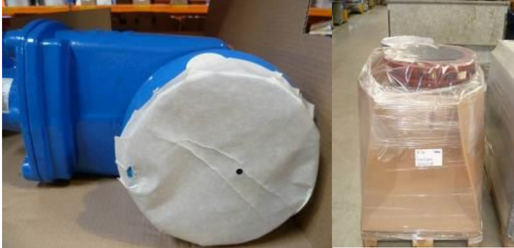
2.3.1 Controleer de verpakking van de te installeren onderdelen.