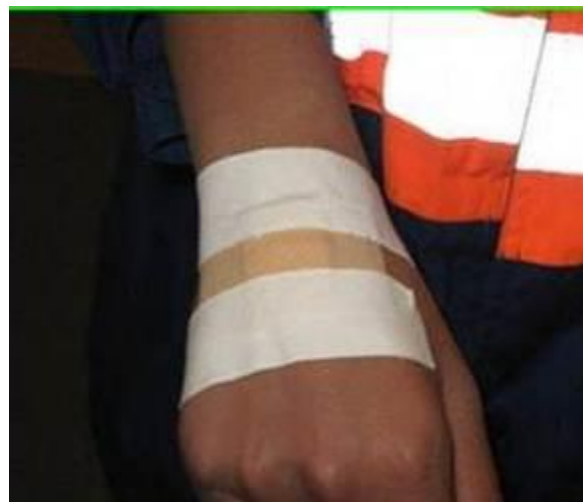
2.1.3 Zorg voor een stevige afdekking op wondjes aan de handen.