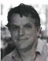
Ad de Man (WBL)

Rioolwaterzuiveringen kunnen geneesmiddelen slechts gedeeltelijk uit het afvalwater krijgen. Zuiveringstechnieken voor drinkwater zijn daartoe wel in staat, maar zijn minder geschikt voor het effluent van rioolwaterzuiveringen. Daarin zit namelijk veel organisch materiaal. Is het mogelijk en rendabel om dit eerst te verwijderen en het afvalwater daarna een geavanceerd oxidatieproces te laten ondergaan?