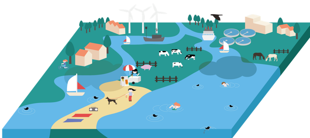
Afbeelding 1. Illustratie van verscheidene bronnen die de zwemwaterkwaliteit kunnen beïnvloeden.

Conform de zwemwaterrichtlijn van de EU worden zwemwaterlocaties – op basis van de concentraties aan fecale indicatoren ( E. coli en intestinale enterococcen) – ingedeeld in vier kwaliteitsklassen: slecht, aanvaardbaar, goed of uitstekend. Veruit de meeste Nederlandse zwemwaterlocaties scoren in de klasse ‘goed’ of ‘uitstekend’. Een beperkt aantal locaties scoort momenteel ‘slecht’. De beoordeling van zwemwaterlocaties vindt plaats op basis van periodieke metingen van de concentratie E. coli en intestinale enterococcen in het water. Deze indicatorbacteriën komen algemeen voor in darmen van warmbloedige dieren. Zij geven een indruk van de concentratie fecaal materiaal in water en daarmee de mogelijke aanwezigheid van ziekteverwekkende micro-organismen. Bekende bronnen van fecale verontreiniging in oppervlaktewater zijn o.a.: de aanwezigheid van (water)vogels, vervuiling door recreanten, afspoeling van agrarisch gebied, effluentlozing door RWZI's, overstorting uit rioolwater- of hemelwaterriolering, aanwezigheid van wilde fauna en afspoeling van honden feces (zie afbeelding 1).