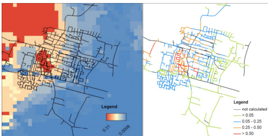
Afbeelding 3. Voorbeeldberekening van COMSIMA (= COMputation Stresses In MAins)

Links de zettingen van de bodem en rechts de spanningen (ten opzichte van de vloeispanning van het leidingmateriaal) in een leidingnetwerk als gevolg van zettingen.