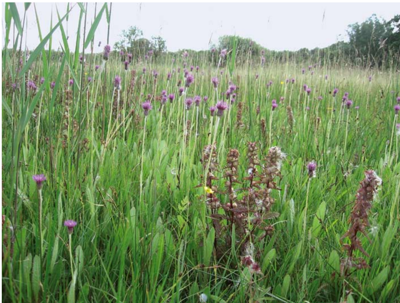
Blauwgrasland met spaanse ruiter ( Cirsium dissectum ) en moeraskartelblad ( Pedicularis palustris ) in de Dommelbeemden bij Sint-Oedenrode. Dit vegetatietype is afhankelijk van de aanvoer van basenrijk grondwater en is overal in Nederland sterk achteruitgegaan door het verdwijnen van kwel.

natuurdoelstellingen, op basis van de doelrealisatiefuncties uit Waterlood. Waterlood is het instrument dat is ontwikkeld om waterbeheerders inzicht te geven in de eisen die vanuit natuurdoelstellingen worden gesteld aan de waterhuishouding 3 . De doelrealisatiefuncties uit Waterlood geven aan binnen welk bereik van grondwaterstanden beoogde vegetatietypen kunnen voorkomen 4,5 . Om de grondwaterstandgegevens te corrigeren voor de effecten van toevallig natte of droge jaren, wordt een vijfjaarlijks voortschrijdende tijdreeks-analyse gebruikt. Daarbij wordt voor elke achtereenvolgende periode van vijf jaar een tijdreeksmodel opgesteld, waaruit de voor weersomstandigheden gecorrigeerde grondwaterstand in het midden van die periode wordt berekend. Door deze gecorrigeerde grondwaterstanden uit te zetten tegen de tijd, kan inzicht worden verkregen in veranderingen in het hydrologische systeem. Afbeelding 2 geeft het resultaat van de tijdreeksanalyse voor het toestandmeetpunt in de Kampina met de voor weersomstandigheden gecorrigeerde hoogste grondwaterstanden (GHG), voorjaarsgrondwaterstanden (GVG) en laagste grondwaterstanden (GLG) per vijfjaarsperiode uitgezet tegen de tijd.