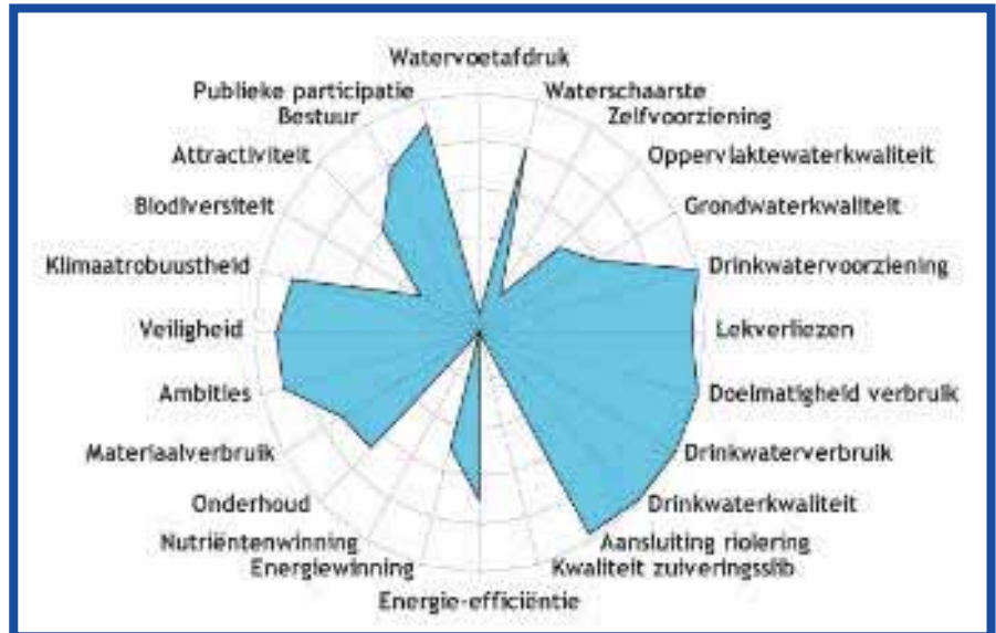
Afb. 3: De duurzaamheid van de waterketen van Rotterdam aan de hand van 24 indicatoren. De scores lopen van 0 (middenpunt van de cirkel) tot 10 (omtrek). Scores van 5 en lager vergen aandacht 15) .