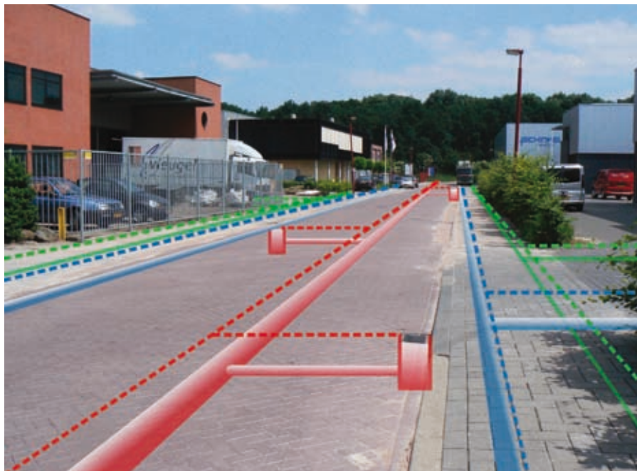
Afb. 2: De ligging van kabels en leidingen, zoals te zien door een augmented reality-bril.

verschillende infrastructures aanwezig zijn of waar de kosten van overlast hoog zijn, zoals in stedelijke centra of rondom verkeersaders. Uitwisseling van ligginggegevens met andere beheerders en de gemeente kan ook leiden tot een betere coördinatie bij ongevallen- en rampenbestrijding. Het zal mogelijk zijn snel in te schatten welke infrastructuur aanwezig is, welke moet worden uitgeschakeld en welke juist niet en welke acties daarvoor nodig zijn. Ook zal beter inzicht ontstaan in de gevolgen die falen van een bepaald type infrastructuur heeft op andere infrastructures.