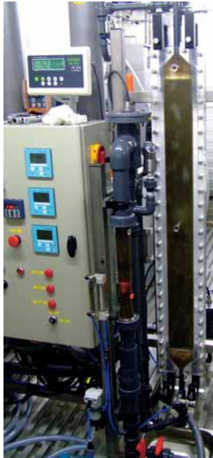
De proefinstallatie van de osmotische membraanbioreactor te Horstermeer.

Van belang qua duurzaamheid zijn bijvoorbeeld mitigatie- en adaptatiemaatregelen