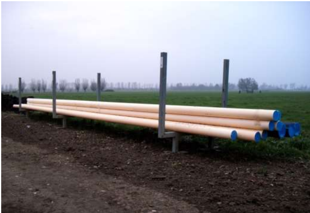
Figuur 3 De wijze van opslag van buizen op werklocaties.