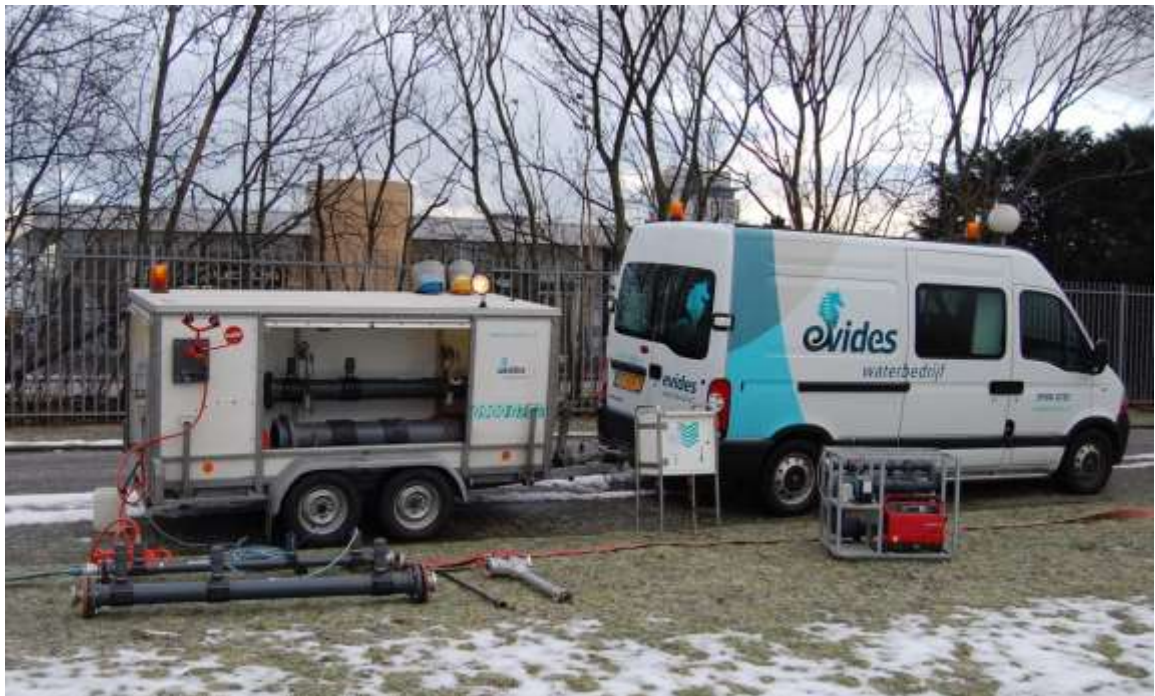
Figuur 2 Overzicht van mogelijke hulpapparatuur voor desinfectie van het leidingnet.

Er zijn toestellen ontwikkeld voor het desinfecteren en spuien van leidingen (zie Figuur 2). Hiermee wordt het desinfectiemiddel van te voren met drinkwater gemengd en vervolgens in de leiding gebracht. Toestellen als dit worden tevens gebruikt voor het neutraliseren van het desinfectiemiddel in het spuiwater.