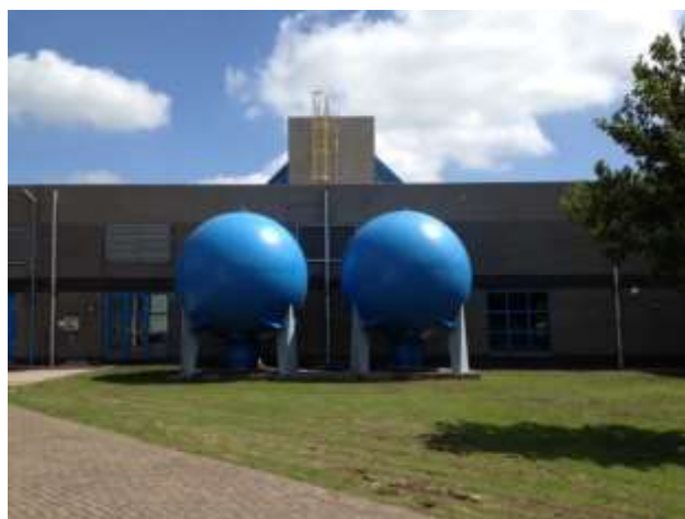
Waterslagtanks op zuiveringsstation 'De Steeg'.