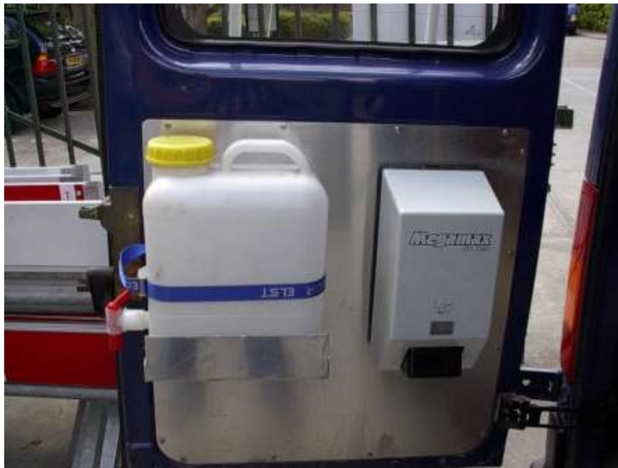
Figuur 1 Voorzieningen in een monteursbus ten behoeve van hygiënisch werken.

Bij langdurige werkzaamheden (bijvoorbeeld bij de aanleg van nieuwe leidingen) dient ook een mobiel toilet aanwezig te zijn. Monteurs die storingen verhelpen (waarbij het soms primair gaat om 'veilig stellen', wat in tweede instantie 'gepland werk' wordt), hebben geen mobiel toilet beschikbaar. In dat geval dient gebruik te worden gemaakt van andere (aanwezige) voorzieningen.