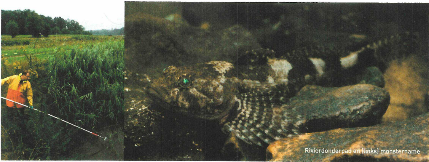
Rivierdonderpad en (links) monstername