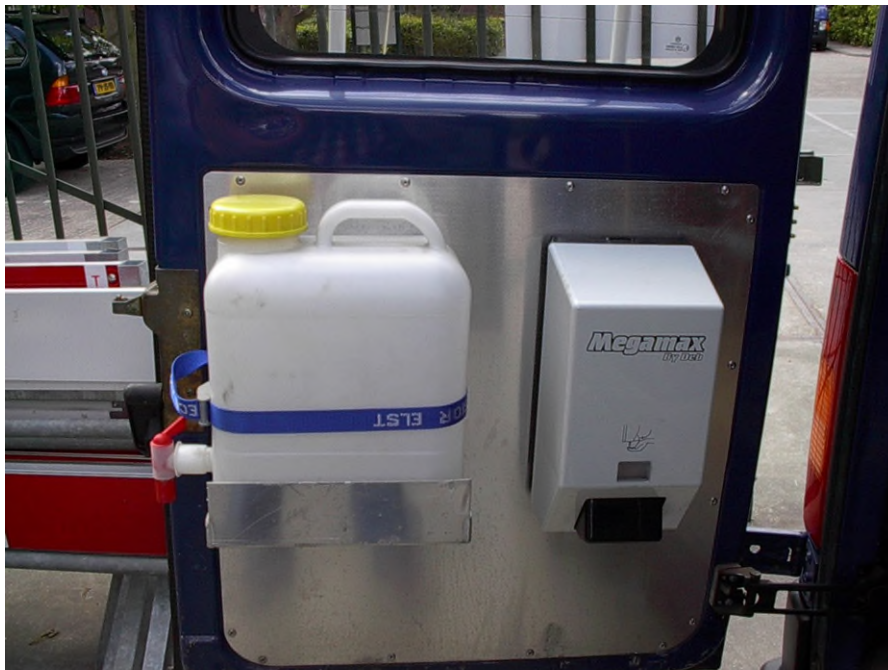
Figuur 1 Voorzieningen in een monteursbus ten behoeve van hygiënisch werken.

Bij langdurige werkzaamheden (bijvoorbeeld bij de aanleg van nieuwe leidingen) dient ook een mobiel toilet aanwezig te zijn. Monteurs die storingen verhelpen (waarbij het soms primair gaat om 'veilig stellen', wat in tweede instantie 'gepland werk' wordt), hebben geen mobiel toilet beschikbaar. In dat geval dient gebruik te worden gemaakt van andere (aanwezige) voorzieningen.