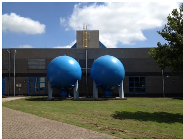
Waterslagtanks op zuiveringsstation 'De Steeg'.