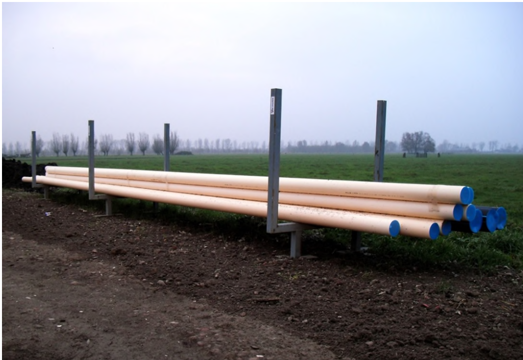
Figuur 3 De wijze van opslag van buizen op werklocaties.