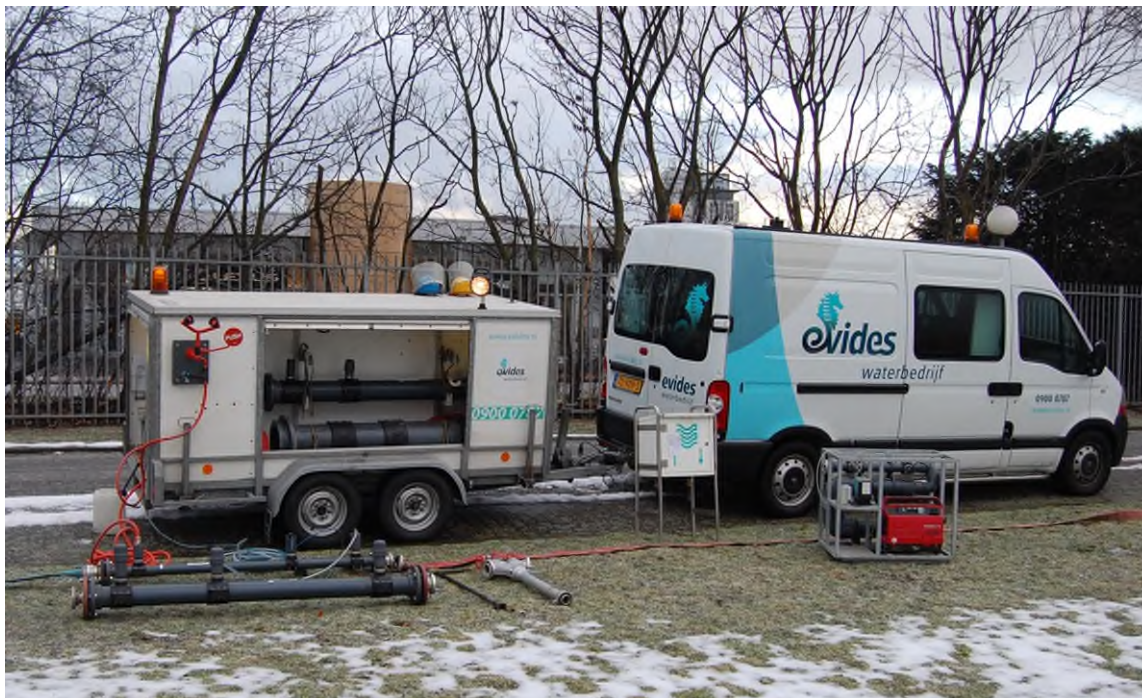
Figuur 2 Overzicht van mogelijke hulpapparatuur voor desinfectie van het leidingnet.

Er zijn toestellen ontwikkeld voor het desinfecteren en spuien van leidingen (zie Figuur 2). Hiermee wordt het desinfectiemiddel van tevoren met drinkwater gemengd en vervolgens in de leiding gebracht. Toestellen als dit worden tevens gebruikt voor het neutraliseren van het desinfectiemiddel in het spuiwater.