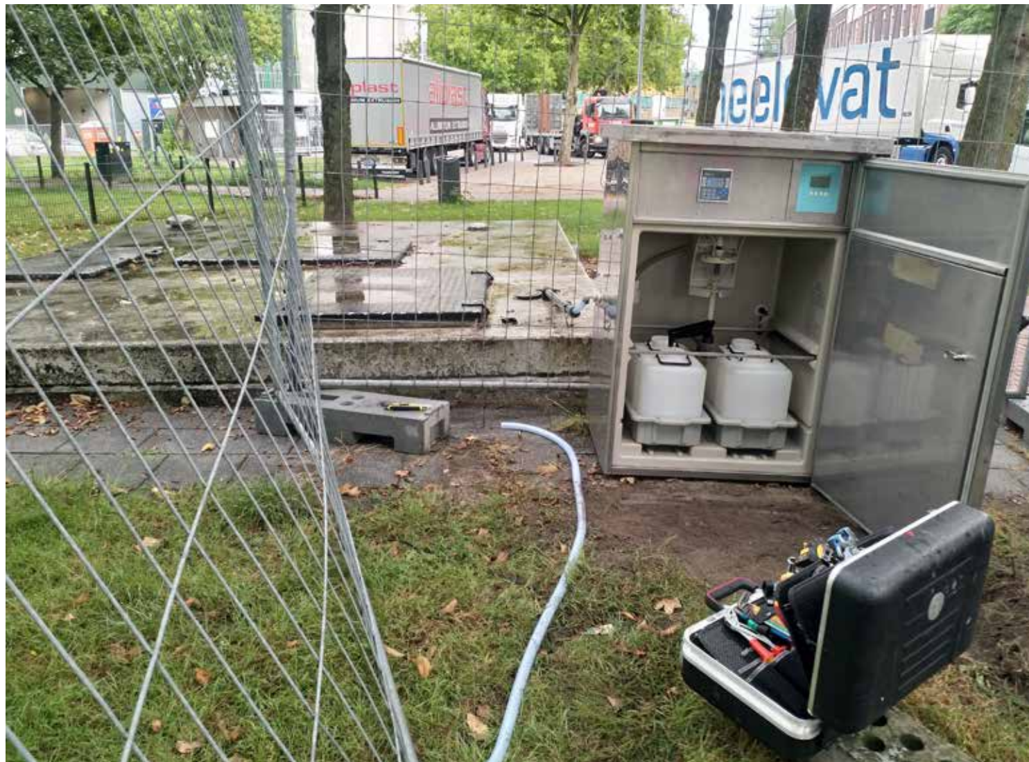
Monsternamekast bij het ondergrondse rioolgemaal Katendrecht. De apparatuur voegt op gezette tijden een beetje rioolwater toe aan een monsternamevat, om een representatief 24-uurs monster te krijgen.