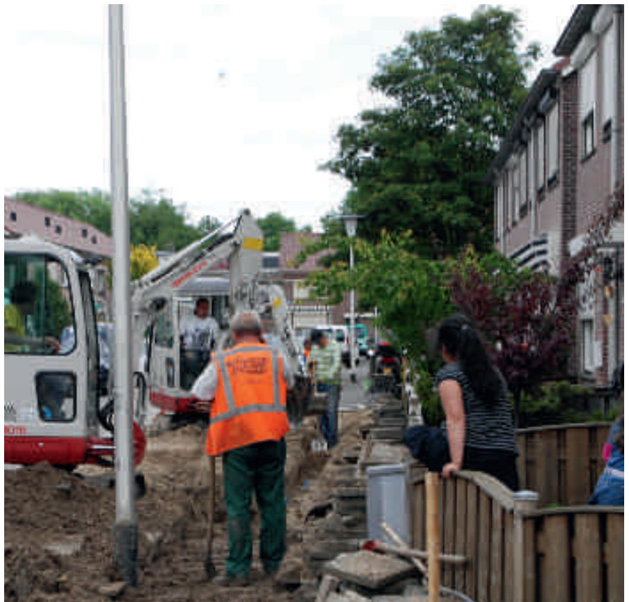
Vervangen van leidingen in Helmond.

Na het uit gebruik nemen van de watertoren in het centrum van Helmond is de transportstructuur eromheen deels blijven liggen. Een goed herontwerp vergt een inschatting van de toekomstige situatie in een verbruiksgebied.