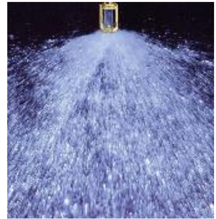
Sprinklerkop in bedrijf.

De ontwerpparameters voor een sprinklerkop zijn de diameter van de uitstroomopening en de diameter en vormgeving van het verdeelplaatje onder de uitstroomopening. Het sproei patroon en de hoeveelheid water c.q. de opbrengst van de