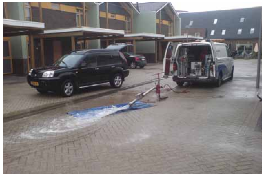
Spuien van het vertakte net in Rosmalen. Intussen wordt (online) de troebelheid gemeten.

De accumulatie van opwervelbaar sediment wordt bepaald met spuiproeven waarbij de troebelheid wordt gemeten. Dit kan op drie manieren (zie afbeelding 1):