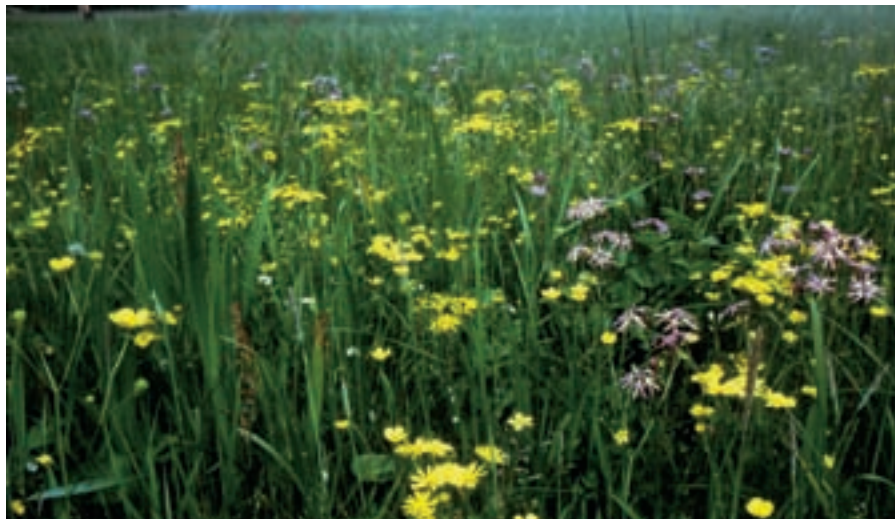
Natte kwelgevoede schraallanden zouden kunnen profiteren van klimaatverandering, mits inundatie met verontreinigd beekwater achterwege blijft.

Monitorings- en modelonderzoek kunnen behulpzaam zijn bij het signaleren van mogelijke klimaateffecten. Dit zou er toe kunnen leiden, dat natuurdoelen regelmatig moeten worden bijgesteld.