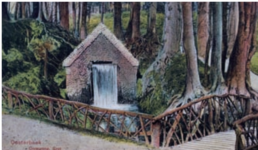
Aansichtkaart van rond 1900, weergevend een romantisch grothuisje in een sprengbeek bij Oosterbeek. De afvoer op deze locatie bedraagt tegenwoordig ongeveer vijf liter per seconde, terwijl deze prent een veelvoud daarvan laat zien. Zullen door klimaatverandering oude tijden gaan herleven?

scenario W, dat op jaarbasis weliswaar natter is dan het huidige klimaat, maar dat een iets drogere zomer kent en meer meteorologische variatie tussen de jaren. Klimaatverandering zou al met al een stimulans moeten zijn het anti-verdrogingbeleid en de uitbreiding van de ecologische hoofdstructuur met grotere voortvarendheid uit te voeren.