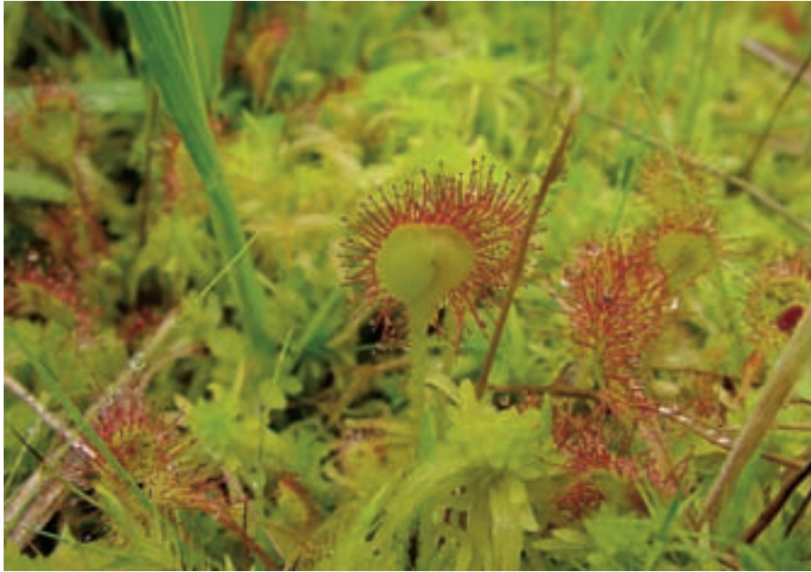
Is er nog toekomst voor natte door regenwater gevoede ecosystemen met onder andere veenmos en ronde zonnedauw als het droge en warme W+-scenario werkelijkheid wordt? (foto: Remco van Ek).

paragraaf). De kweltoename zou gunstig zijn voor de biodiversiteit van sprengen, beken, natte duinvalleien en door kwelwater gevoede schraallanden, zoals die voorkomen in het laagveenmoeras net aan de westelijke voet van de Utrechtse heuvelrug. Daar staat bij scenario W+ een ongunstige verandering tegenover, namelijk dat als de kweltoename onvoldoende is, de grondwaterstand in de loop van de drogere zomer dieper kan wegzakken (onder scenario W verandert de laagste grondwaterstand nauwelijks). Voor een dergelijk kweltoename moet het infiltratiegebied voldoende groot zijn.